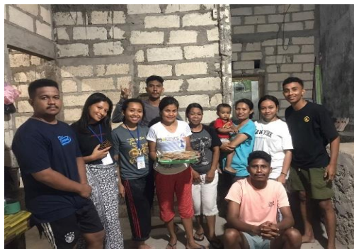
Gambar 2. Foto Bersama Setelah Produk Kripik Pisang