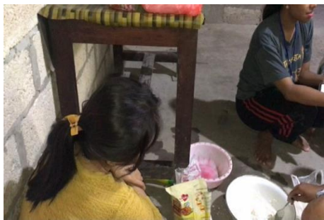
Gambar 1. Penggorengan Keripik