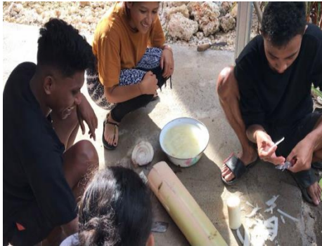
Gambar 1. Persiapan Bahan Sudah Jadi

tentang strategi pemasaran, diskusi dengan Ibu-ibu Rumah Tangga berkaitan dengan penjualan produk melalui media online.