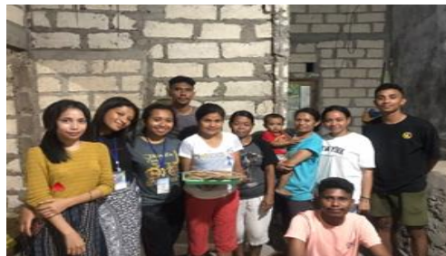
Gambar 1. Produk Keripik Batang Pisang

Hasil dari kegiatan ini berupa deskripsi tentang pelaksanaan kegiatan dan deskripsi tentang pelaksanaan kegiatan dan deskripsi tentang cara mempromosikan produk dengan baik melalui media social. Selanjutnya, pada tahap pelatihan, anggota kelompok Ibu-ibu Rumah Tangga mendapatkan materi tentang penggunaan media elektronik sebagai media pemasaran produk. Melalui system praktik secara langsung, peserta dapat lebih mudah mengikuti materi yang disampaikan dan dapat langsung mengupload produk yang akan dipasarkan. Keterbatasan pada pengguna facebook, adalah pangsa pasar atau pengguna facebook saat ini tidak terlalu diminati oleh Masyarakat khususnya remaja atau anak muda, sehingga perlu adanya pelatihan untuk pertemuan selanjutnya yang membahas digital marketing dengan pangsa pasar anak muda.