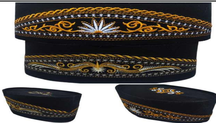
Gambar 2. Salah Satu Kopiah Buatan Bapak M. Abdul Ghony

Internet marketing yaitu usaha perusahaan dalam menjalin hubungan dengan konsumen melalui media internet untuk mempromosikan barang dan jasanya. Dalam peper [5] Digital Marketing merupakan suatu proses perencanaan dan pelaksanaan dari konsep, ide, harga, promosi dan distribusi. Media yang digunakan merupakan situs umum yang jaringan komputernya sangat besar dengan tipe berbeda di seluruh Dunia yang terhubung dalam satu wadah. Strategi internet marketing yang dibangun sebagai strategi pemasaran industri kopiah Temboro yaitu website pemasaran E-commerce dan memanfaatkan sosial media yang berbasis bisnis[6]. Dengan adanya E commerce mamapu meningkat Ewom bagi masyarakat. meningkatkan E-WOM yang mana E-WOM mampu menyebarkan informasi melalui media online atau Internet, seperti email, blog, ruang obrolan, Facebook, Twitter dan berbagai jenis jejaring sosiallainnya[7]