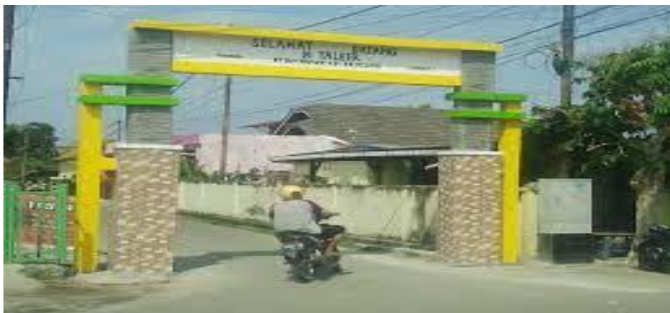
Gambar 1. Gapura Masuk Desa Bandar Agung Kec. Lubuk Batang

Dari hasil kunjungan ke tempat industri kopiah Resam bapak M. Abdul Gony ada beberapa permasalahan yang dihadapi yaitu terletak pada pemasaran. Pada aspek pemasaran industri kopiah Resam hanya mengandalkan pemasaran secara tradisional, yaitu dari toko ke toko dan mulut ke mulut. Sehingga jangkauan konsumen masih relatif sedikit. Strategi pemasaran belum memanfaatkan internet marketing , dikarenakan belum adanya informasi cara memanfaatkan internet sebagai strategi pemasaran. Perlu adanya pemasaran online untuk memperluas pasar dari produksi kopiah Resam. Hal ini sesuai paper [1] dalam pemasaran online mempunyai banyak keuntungan Diantaranya mudahnya biaya dalam pemasaran dan transaksi jual beli. yang mana modal masih menjadi kendala bagi wirausaha dalam menjalankan usahanya [2]. Melihat perkembangan digitalisasi yang semakin semarak dan memasuki berbagai kalangan masyarakat. Inovasi sebagai solusi permasalahan tersebut perlu diterapkan internet marketing sebagai strategi pemasaran. Inovasi mampu memberikan nilai positif bagi pelaku UMKM, terutama dimasa new normal dengan melihat menurunnya minat konsumen maka dibutuhkan inovasi baru untuk meningkatkan ketertarikan konsumen dan mencari pangsa pasar baru. [3] dengan inovasi mampu meningkatkan nilai value suatu barang [4].